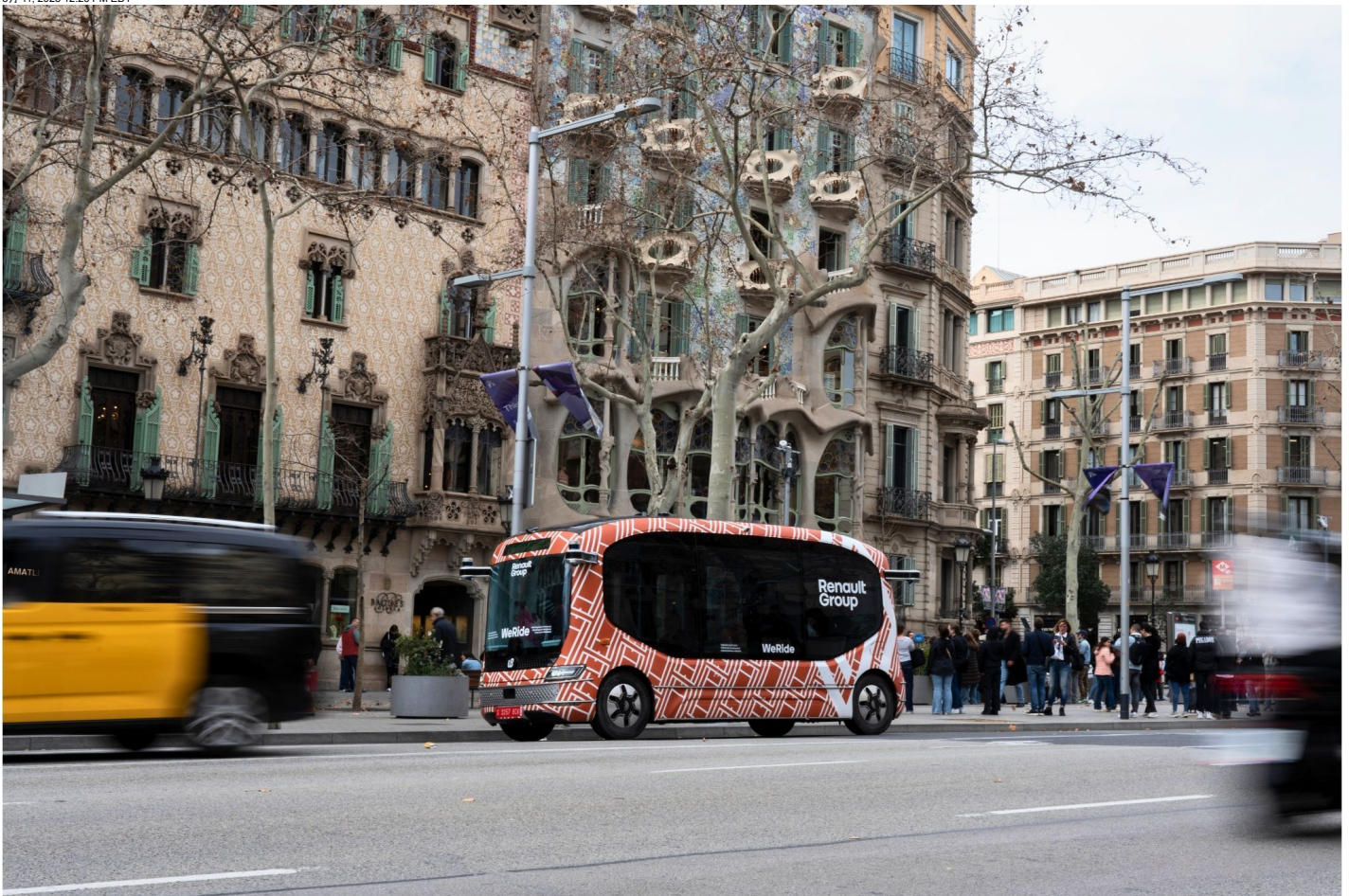
当地时间2025年3月11日，全球领先的自动驾驶科技公司文远知行WeRide (Nasdaq: WRD) 宣布与雷诺集团在巴塞罗那市中心开展自动驾驶小巴 (Robobus) 试乘服务。这是西班牙首个公开道路前装量产自动驾驶运营服务，充分展现了文远知行在高密度、复杂城市交通场景中的自动驾驶技术实力。