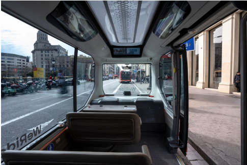
(文远小巴在巴塞罗那开展测试运营)

“此次巴塞罗那试运营是文远知行国际化战略的又一重要成果，彰显了我们在亚洲市场之外向欧洲核心市场拓展的技术领导力。”文远知行创始人兼CEO韩坤表示，“这不仅是对我们技术成熟度的认可，更是双方战略合作的升级，法国项目验证了我们的车辆在大型需求场景的可行性，而此次西班牙试运营延伸了市中心公共交通领域，将为双方的2030战略目标夯实基础，也进一步展现了文远知行为实现让无人驾驶普及全球这一愿景做出的实际行动。”