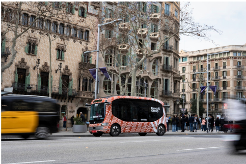
(文遠小巴行駛在巴塞隆納限區) 經巴塞隆納市交通總局(Directorate General of Traffic, DGT) 授權許可，本次文遠小巴試運營服務將於3月10日至14日，每天11:00-17:00向公眾開放，運營路線約2公里，沿途設置4個上下車站點，途經巴塞隆納巴特羅之家(Casa Batlló)和米諾之家(La Pedrera)等地標性建築。